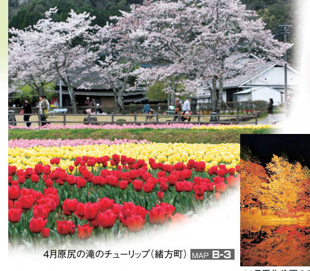
4月原尻の滝のチューリップ(緒方町) MAP B-3

このパンフレットに掲載している情報は変更となる場合がございますので、最新の情報や詳細については事前に確認されることをお勧めします。