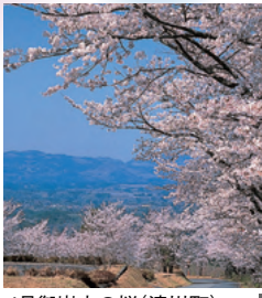
4月御嶽山の桜(清川町) MAP C-4