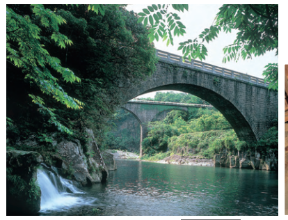
出会橋と轟橋(清川町) MAP B-4

石文化財の宝庫として知られる大野川流域。国内最大級の磨崖仏や、石仏、石橋など、その一つひとつにドラマが刻まれています。