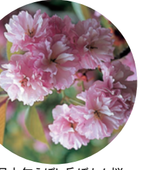
4月中旬えびし岳ぼたん桜(大野町) MAP D-1