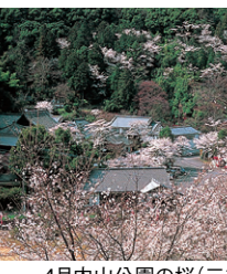
4月内山公園の桜(三重町) MAP D-4