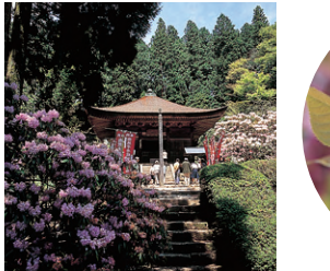
4月中旬神角寺のシャクナゲ(朝地町) MAP C-1