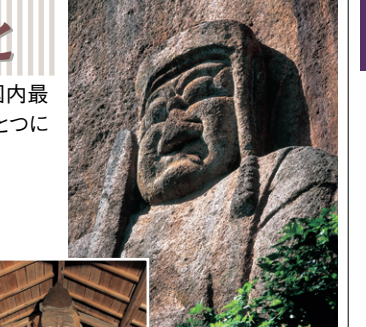
大迫磨崖仏(千歳町) MAP E-2