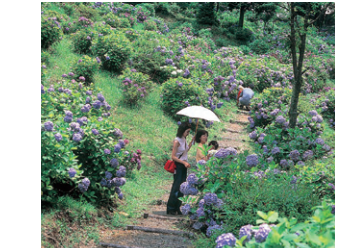
6月大辻公園のアジサイ(三重町) MAP E-3