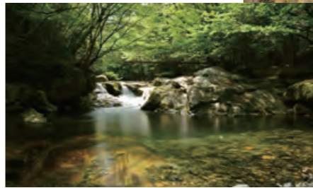
川上渓谷 奥岳川の最上流にあり、花崗岩の白い河床と新緑のコントラストが美しい。