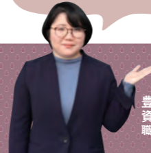
豊後大野市資料館職員

郷土芸能を継承する人の多さ、しかもしっかりと芸が受け継がれているところが素晴らしいと思います。派手な動きや衣裳にも注目しながら鑑賞してください。