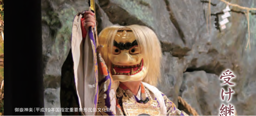
御獄神楽(平成19年国指定重要無形民俗文化財)