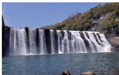
ちんだ たき 沈墜の滝 ちんだばくす 雪舟が「鎮田瀑図」に描いた「沈墜の滝」。幅100m、落差20mの美しい姿が多くの人を魅了する。