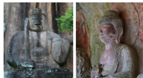
すがお まがいがつ ふこうじ まがいがつ 菅尾磨崖仏・普光寺磨崖仏 火砕流堆積物の岩壁に彫られた「菅尾磨崖仏(右)」と「普光寺磨崖仏(左)」。後者は国内最大級の大きさ。

自然が創った景観は美しくもあるが、一方で人々が暮らすには険しくもあった。そのため先人たちは知恵を用いて、火砕流によってできた岩を使い橋を架けた。その最たるものが、アーチ式石橋としてアーチ径の長さが日本1・2位を誇る「出会橋・轟橋」。特に轟橋は、祖母・傾の国有林から木材を運ぶための鉄道橋だったという文化も今日に伝えている。「辻河原の石風呂」も貴重だ。火砕流の堆積物でできた岩に穴を掘り、葉草を敷き詰めて蒸気浴をしたのである。天然の岩盤浴だ。さらに人々は、火砕流堆積物の壁に仏も彫刻した。「菅尾磨崖仏」や「普光寺磨崖仏」は、穏やかな表情でまがが豊かであるよう見守り続けている。 地球が残した遺産、そして人間が残した遺産。その両方があるからこそ魅力的な、おおいた豊後大野ジオパーク。それは阿蘇火山の巨大噴火から続く、大地の物語なのである。