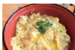
豊のしゃも親子丼

道の駅おおのは、大自然の恵みを受けて育った新鮮野菜や加工品など、地域の農家のみなさんが手塩にかけて育てた安心で美味しい特産品を多数揃えています。食事処では特産地鶏の「豊のしゃも」を使ったメニューがオススメです。