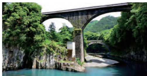
であいばし とどろばし 出会橋・轟橋 奥岳川にかかる「出会橋・轟橋」。アーチ径が日本で1・2位を誇る石橋を同時に眺める。手前が1位の轟橋、奥が2位の出会橋。