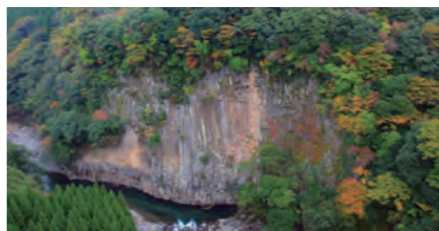
たいざこきょう 滞迫峡の大絶壁 高さ70m超、約11kmもの絶壁が続く「滞迫峡」。ここで火砕流に巻き込まれた木の印象化石や炭化木も発見されている。